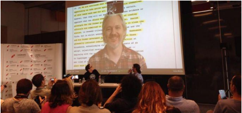
Julian Assange @ #ungovForum, iuf.alternatifbilisim.org, 2014

Bu anekdot fazla güçlü gibi gözükse de, aynı zamanda temsil edici bir anlatımdır. Yeraltı 'ndaki her bir bölüm buna benzeyen bir sürü öykü ile biçimlenmiştir. Görünmezdirler çünkü bir kitabın salt detaylarda hakiki olması yetmez. Hissiyatında hakiki olmalıdır. Görülen ve görülmeyen karşısında hakiki olmalıdır. Zor bir bileştirme.